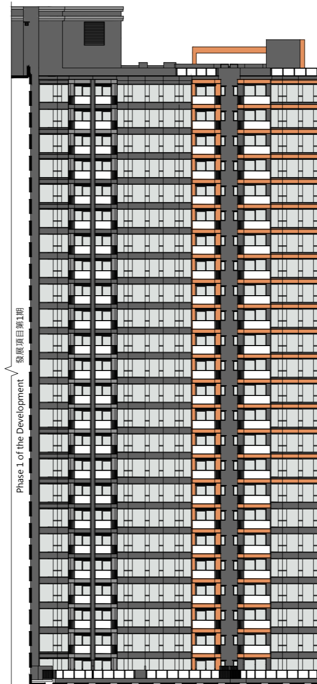
Phase 1 of the Development 發展項目第1期