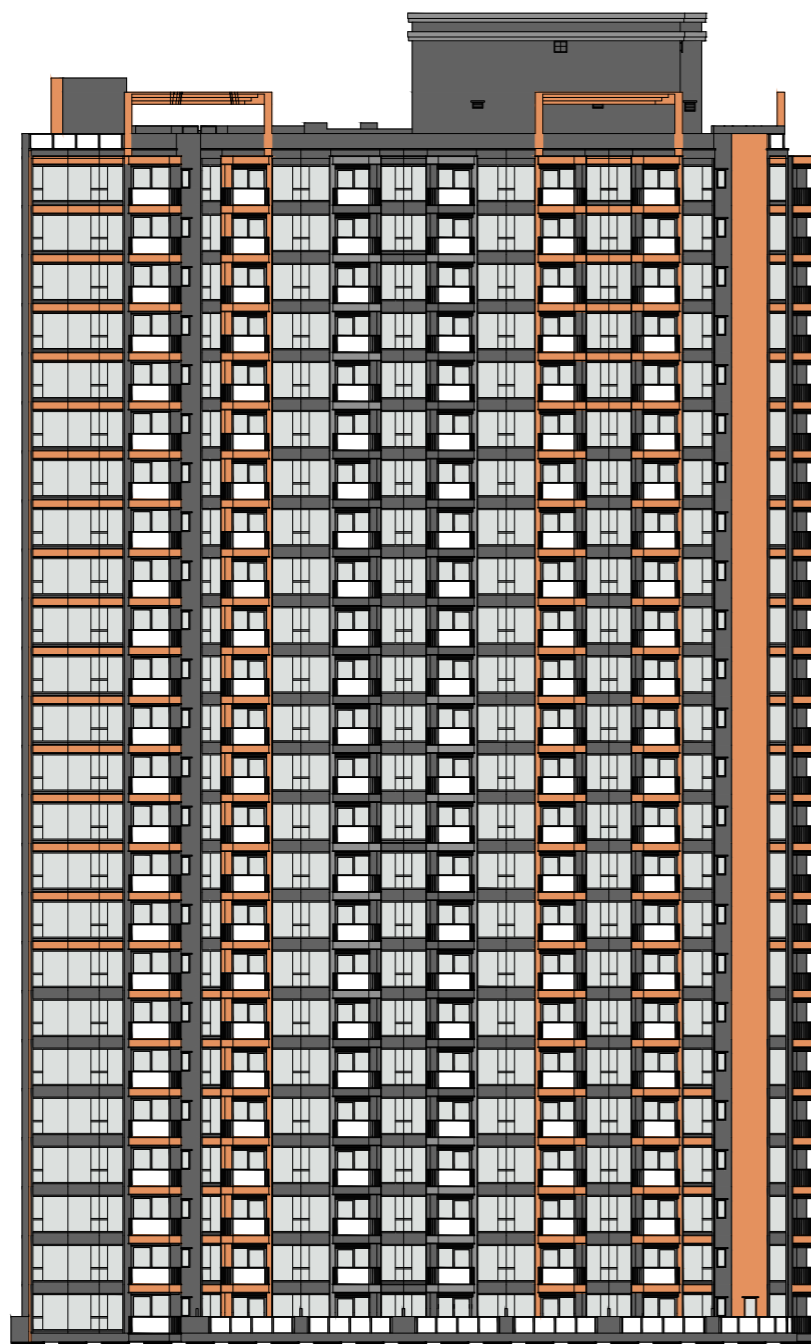
Phase 1 of the Development 發展項目第1期